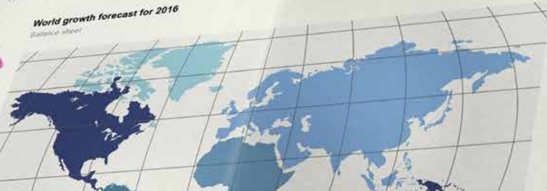
World growth forecast for 2016 Balance sheet

Obviously, this completely rules out venture capital. On the one hand this is making it hard to implement our plan, but on the other hand, I believe we are better off for it as we can focus on a quality product and efficiently achieve our goals. Having said that, we are exploring options for loans to accelerate our growth. Our biggest advantage is the whole stock photography industry is completely amateur. The industry is massively undervalued. What we are doing upstairs with our systems is somehow the world's best.